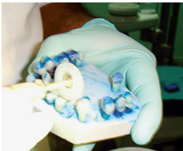
Figura 2. Corte de los dientes (mesio-distal).