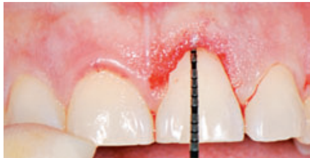
Figura 8. Sondaje para corroborar la nueva distancia de 3 mm entre la cresta alveolar y el margen gingival.

La incisión debe situarse al nivel del LAC y paralela a este con un bisel de 45° hacia el diente, procediéndose a la eliminación del rodete gingival.