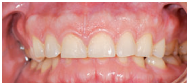
Figura 1. Fotografía inicial. Obsérvese la dimensión de las coronas en relación con la encía adherida. Coronas cortas y antiestéticas.

Luego se remodeló el tejido marginal remanente con una fresa de diamante de grano fino para finalmente obtener una cicatrización por segunda intención mediante la utilización de un apósito quirúrgico.