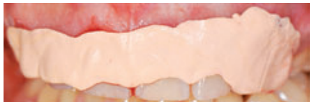
Figura 10. Colocación de un apósito quirúrgico para proteger el lecho quirúrgico y obtener una buena cicatrización por segunda intención.