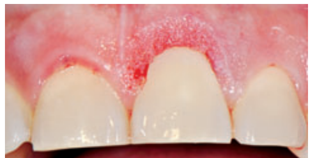
Figura 7. Aspecto del margen gingival de la pieza 2.1 inmediatamente después de la cirugía.