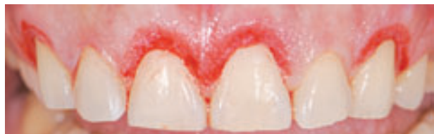
Figura 9. Vista final inmediatamente después de la cirugía.