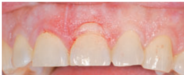
Figura 3. La incisión a bisel externo se realiza con una hoja de bisturí número 15C para obtener mejores resultados estéticos.