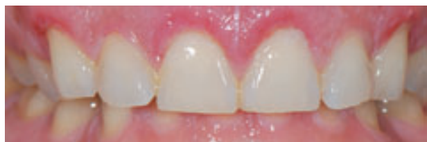
Figura 11. Control post operatorio pasada una semana.