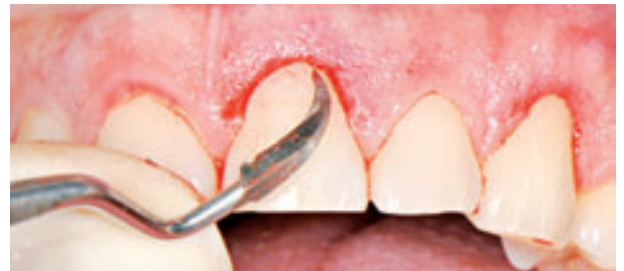
Figura 5. Cureta Crane Kaplan para eliminar el ribete de tejido blando.