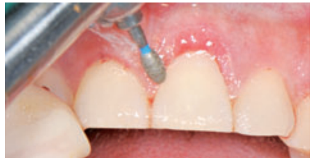
Figura 6. Contorneado final con fresa de diamante.