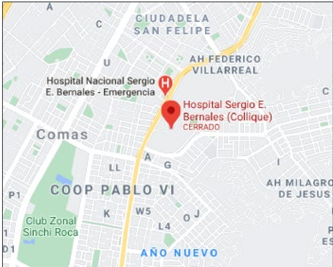
Figura 1. Mapa de localización del Hospital Sergio E. Bernales.