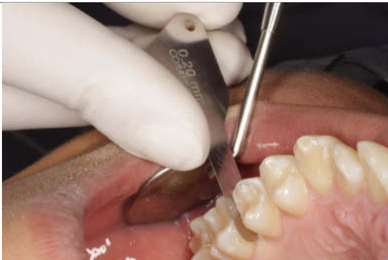
Medición de la distancia, empleando el calibrador.