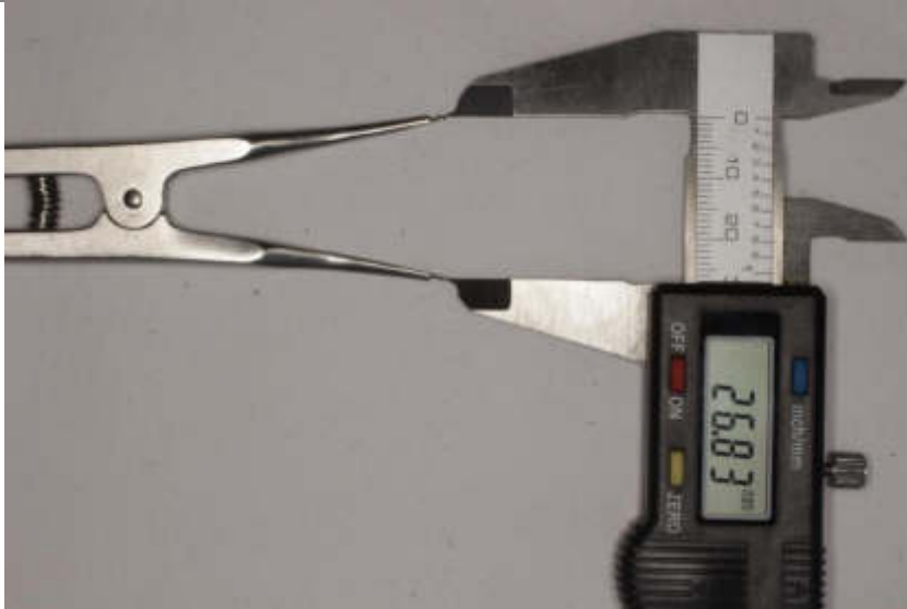
Alicate separador de módulos.