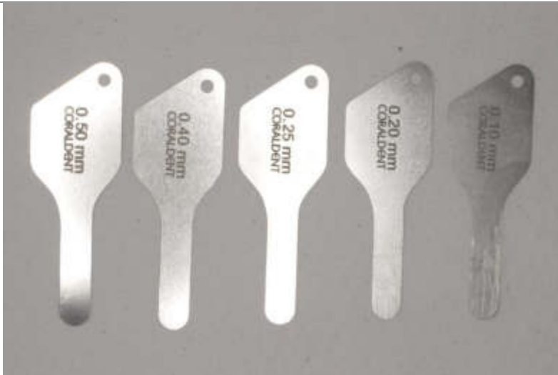
Calibrador de láminas galgas métricas.