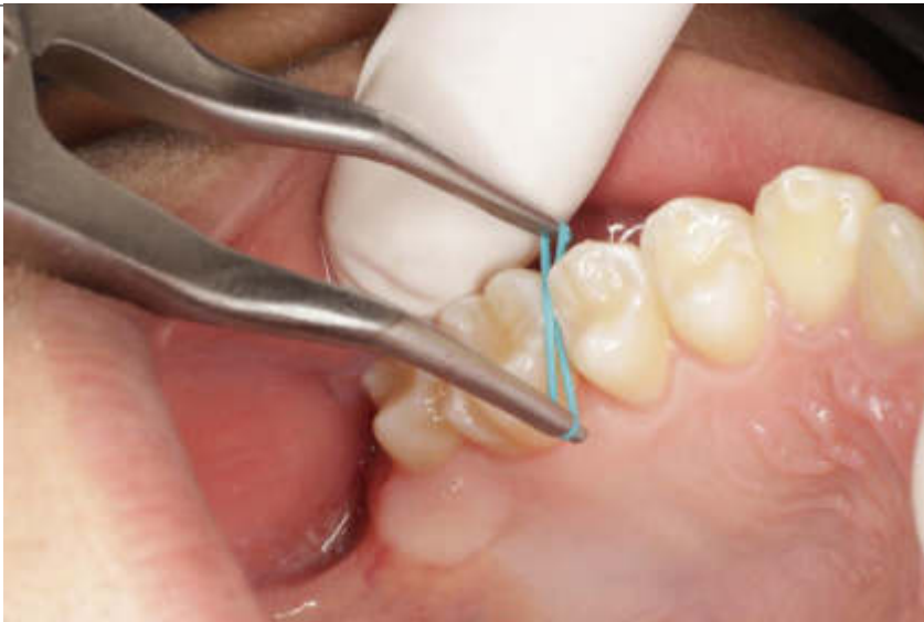
Empleo del alicate separador de módulos.