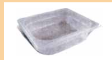
POLIPROPILENO Encaje exterior