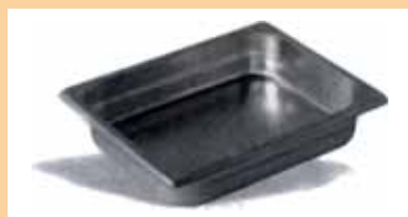
ACERO INOX. Encaje interior