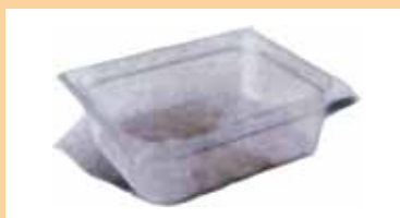
POLICARBONATO Encaje exterior