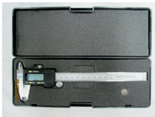
Fig. 8. Calibrador digital.

Para determinar el grado de concordancia en la ubicación del punto "A-B", se realizó el "Juicio de Expertos" y la prueba de "Porcentaje de acuerdo entre los jueces". Para ello se solicitó la evaluación de siete expertos