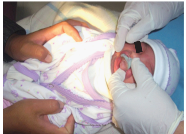
Fig. 4. Registro del maxilar superior. El odontólogo se sienta frente a frente con la madre, juntando ambos las rodillas. La cabeza está dirigida hacia el odontólogo y las piernas hacia la madre, quien además sostiene las manos.