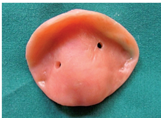
Fig. 6. Cubeta para impresión. Superficie interna.

En cada modelo obtenido de los casos de fisura labiopalatina unilateral, se dibujó con un lápiz 2 puntos el punto "A" en la cresta palatina del lado sano y el punto "B" en la cresta palatina del lado afectado (Fig. 7). El punto "A" visto frontalmente es el punto de unión más inferior y medial entre el paladar primario y el secundario a nivel de la hendidura, y visto horizontalmente, es el punto de unión más anterior y medial entre el paladar primario y el secundario a nivel de la hendidura. El punto "B" visto frontalmente es el punto más superior a nivel de la hendidura, y visto horizontalmente, es el punto más anterior a nivel de la hendidura.