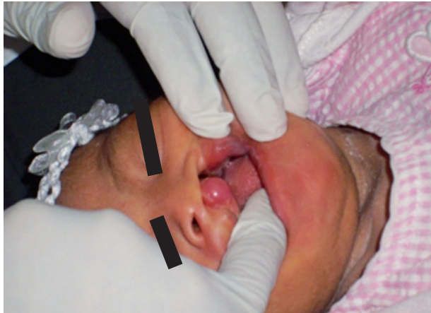
Fig. 1. Neonato con fisura labiopalatina unilateral.

Los neonatos nacidos con fisura labiopalatina unilateral (Fig. 1) que fueron transferidos por interconsulta al consultorio de estomatología del INMP y que cumplieron los requisitos mencionados en los criterios de inclusión, fueron seleccionados para la presente investigación.