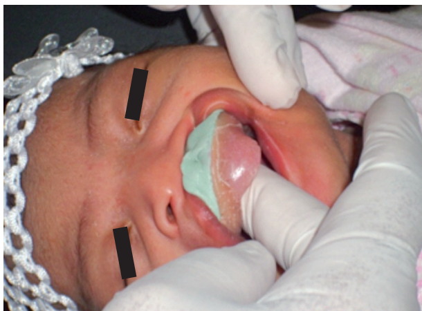
Fig. 2. Registro del maxilar superior.

Para determinar el nivel de fusión de las crestas palatinas, se registró el maxilar superior (Fig. 2, 3, 4) mediante una impresión con silicona pesada Zetaplus – Putty (Zhermack), la cual se realizó mediante unas