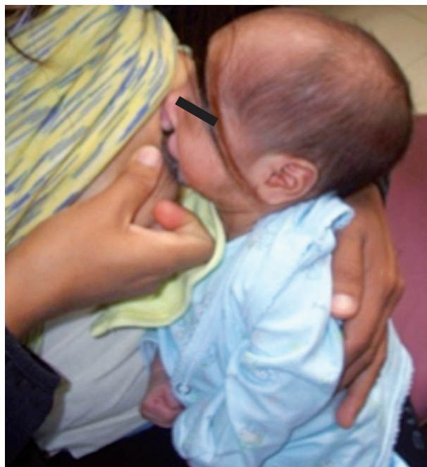
Fig. 10. Neonato con Fisura labio palatina bilateral recibiendo Lactancia materna exclusiva.