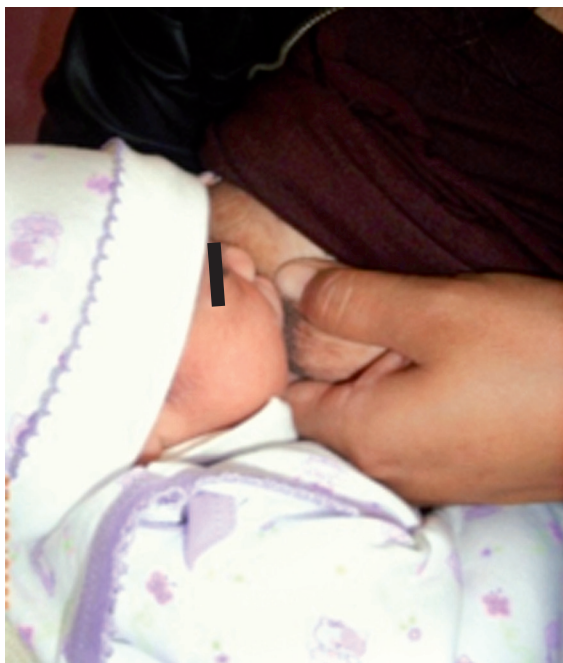
Fig. 9. Neonato con Fisura labio palatina unilateral recibiendo Lactancia materna exclusiva.

La evidencia científica encontrada en el presente estudio demuestra que la LME es la que estimula una mayor fusión de las crestas palatinas, en comparación a la LMNE; aunque con una diferencia estadísticamente no significativa.