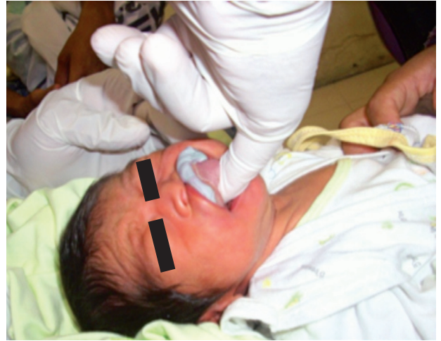
Fig. 3 Registro del maxilar superior.

cubetas confeccionadas especialmente para neonatos (Fig. 5, 6) Para vaciar la impresión se utilizó yeso tipo 4 (velmix).