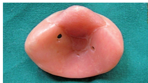
Fig. 5. Cubeta para impresión. Superficie externa.