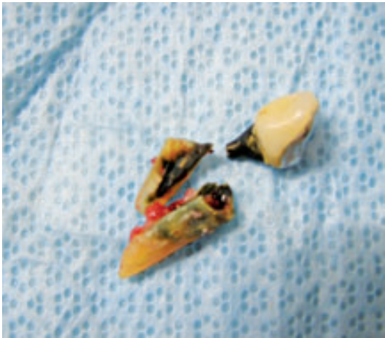
Figura 3. Fractura vertical en pieza con tratamiento de conducto y espigo muñón.

En casos de mucha duda podemos usar la tomografía axial computarizada.