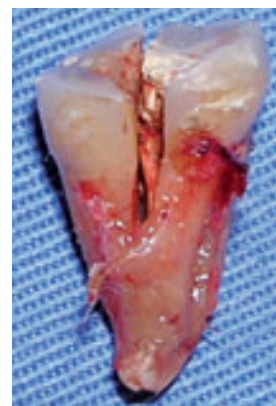
Figura 2. Pieza extraída que muestra fractura vertical mesiodistal.

Puede realizarse una fistulografía con un cono de gutapercha N° 25 y el fin del cono generalmente se hallará donde termina el espigo.