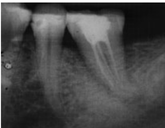
Figura 1. Radiografía de fractura vertical en la pieza 3,6.

Vire (1991) halló, en un grupo de 116 piezas fracturadas, que en el 59,4% la causa era de origen protésico (fractura coronaria, fractura radicular,