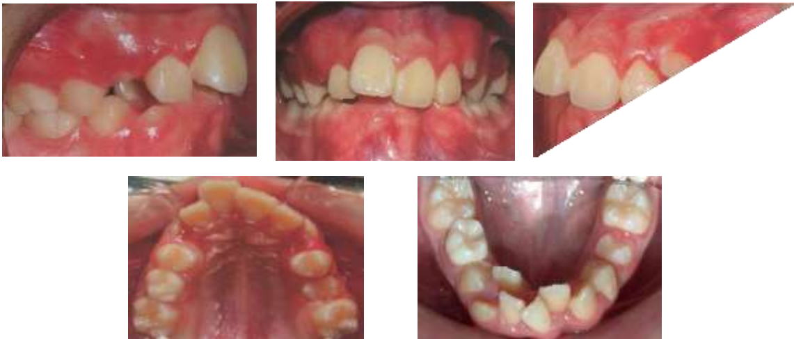
Figura 2: Fotografías Intraorales Iniciales