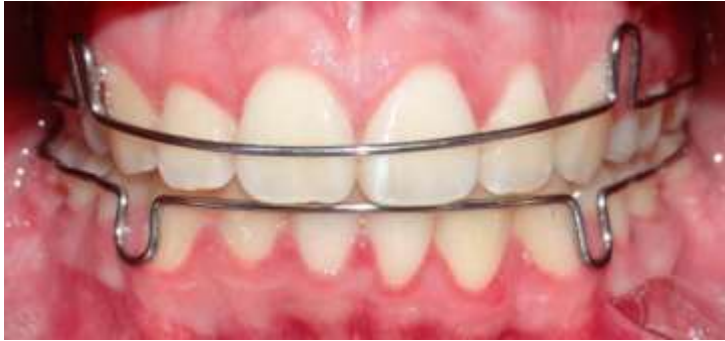
Figura 10: Contención removible superior e inferior tipo Circunferencial