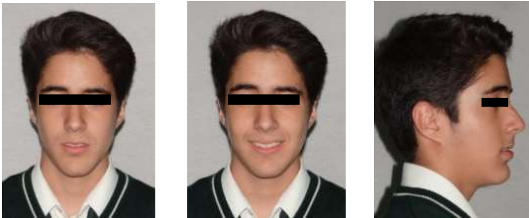
Figura 8: Fotografías Intraorales y Extraorales Finales