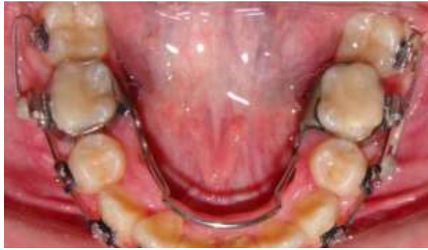
Figura 7: Fotografía Intraoral con dos cantilevers inferiores para verticalizar las piezas 3.7 y 4.7