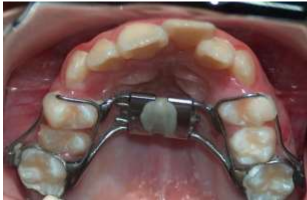
Figura 5: Tornillo de expansión Tipo Hyrax