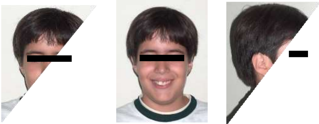
Figura. 1: Fotografías Extraorales Iniciales