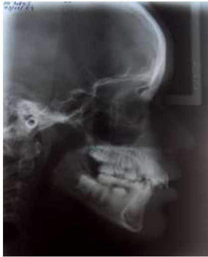
Figura 4: Radiografía Panorámica y Lateral inicial