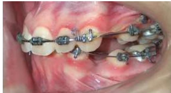
Figura 6: Fotografías Intraorales cierre de espacios superior