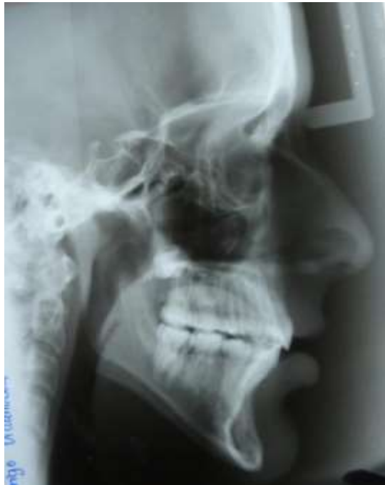
Figura 9: Radiografía Panorámica y Lateral Final