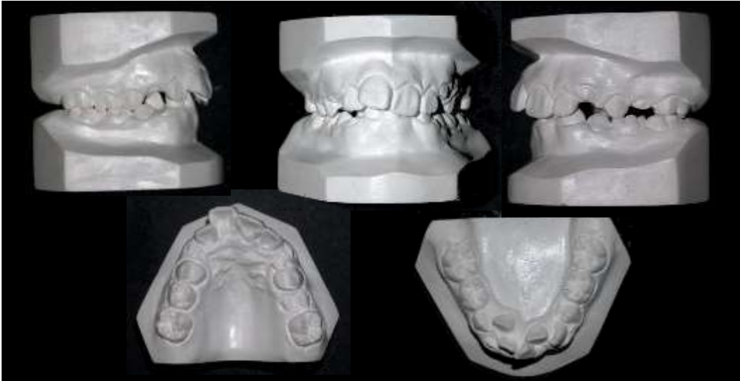
Figura 3: Modelos de estudio Iniciales