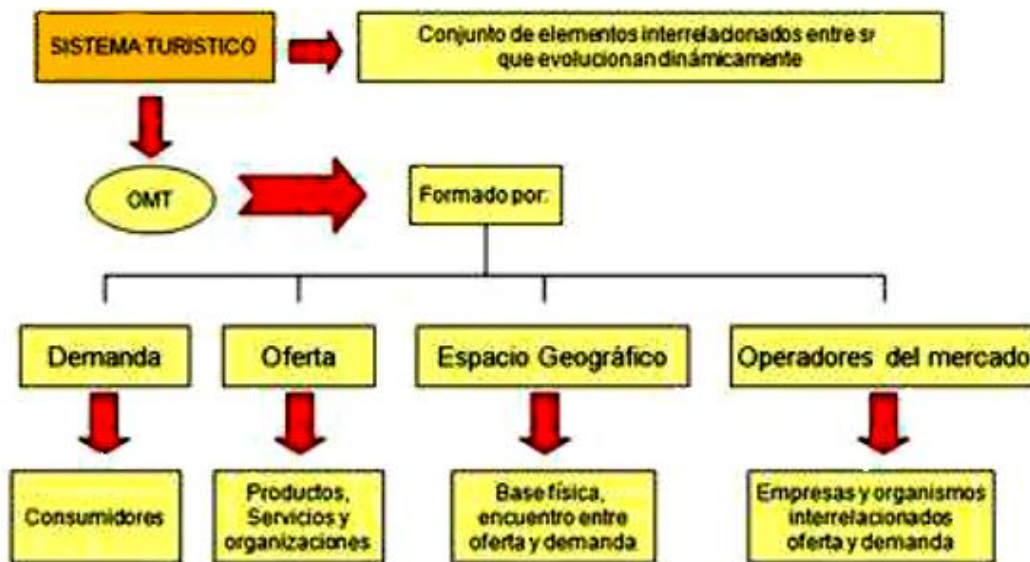
Sistema Turístico OMT

Nota: Adaptado de la (Sancho , 2011, p.39).