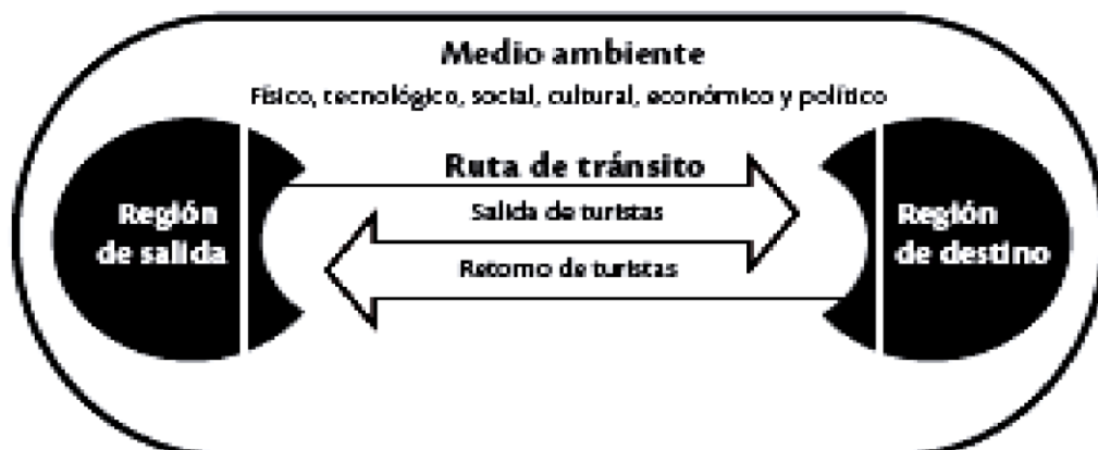
Sistema Turístico de Leiper