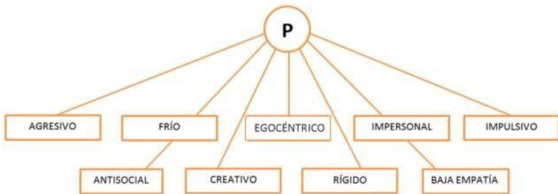
Figura N°4. Rasgos que forman parte de la dimensión Psicoticismo o dureza (Adaptado de Eysenck, 1990a. P.246)

La dimensión del Psicoticismo o Dureza (Flexibilidad – Rigidez Mental), está directamente relacionada con el autocontrol, es decir en puntuaciones extremas podría predisponer a trastornos psicóticos y también a la psicopatía, es usual que los individuos que obtienen alto puntaje presenten como rasgos la impulsividad, agresividad, bajos niveles de empatía, sin embargo, también gran potencial para crear.