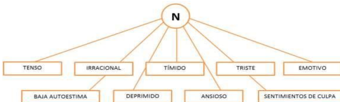
Figura N°3. Rasgos que forman parte de la dimensión Neuroticismo o Emotividad (Adaptado de Eysenck, 1990ª. P.246)

El Neuroticismo o Emotividad (Estabilidad – Inestabilidad Emocional), debido a la excitación emocional o límbica, se relaciona directamente con aquellas conductas que pertenecen a la inestabilidad emocional como trastornos neuróticos, del estado de ánimo, de ansiedad y más. Por tanto, se podrán identificar patrones conductuales en puntajes elevados en esta dimensión como, triste, ansioso, baja autoestima, con sentimiento de culpa y otros similares Eysenck (1991).