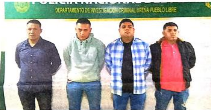
ESTABAN EN UN VEHÍCULO.

◆ Hampones intentaron escapar en un auto.