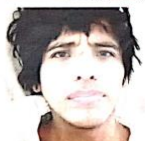
FEMINICIDA ARGUMENTÓ LOS CELOS. LE ESPERA UNA LARGA CONDENA