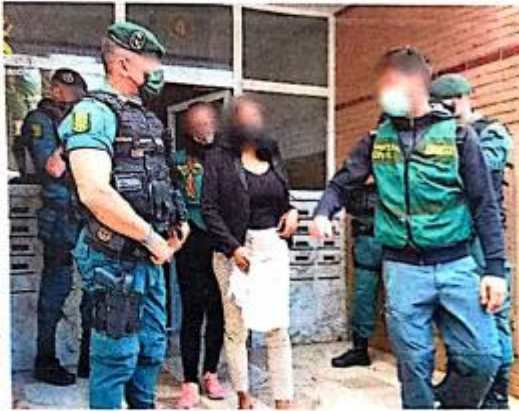
CAPTORES LAS AMENAZABAN CON MATAR A SUS FAMILIARES SI DENUNCIABAN EL HECHO.

Esta operación de rescate comenzó por otra desarrollada días atrás en Toledo, donde la policía pudo rescatar a una joven a la