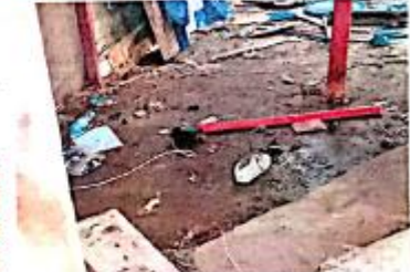
JOVENCITA ESTUVO CON AMIGOS