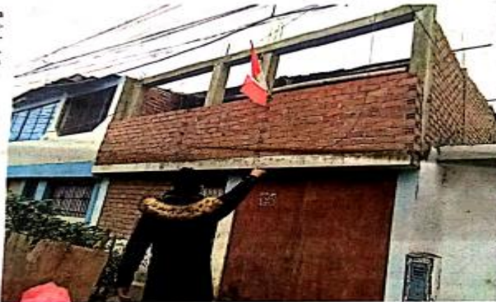
VÍCTIMA HABÍA ACUDIDO A LA CASA TRAS UNA LLAMADA DE SU ENAMORADO Y YA NO VOLVIÓ A SALIR CON VIDA.

"Los jóvenes están diciendo que el enamorado manipuló el arma de fuego le cayó la bala a mi hija de