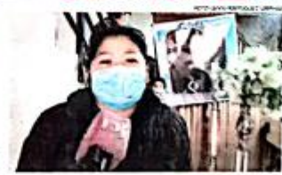
FAMILIA PIDE QUE HOMECIDA NUNCA SALGA

ella, luego de que la policía capturara a la ex pareja de la difunta.