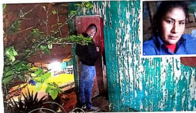
LA POLICÍA ESTÁ TRAS EX ESPOSO QUE HABRÍA VIAJADO A AYACUCHO.

◦ Macabro hallazgo. Una cobradora de transporte público fue encontrada sin vida por su hermano en su vivienda de Villa María del Triunfo.