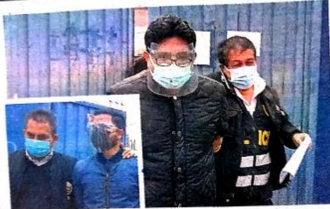
MARTÍNEZ Y CARIGA AFRONTARÁN INVESTIGACIÓN EN LA CÁRCEL.