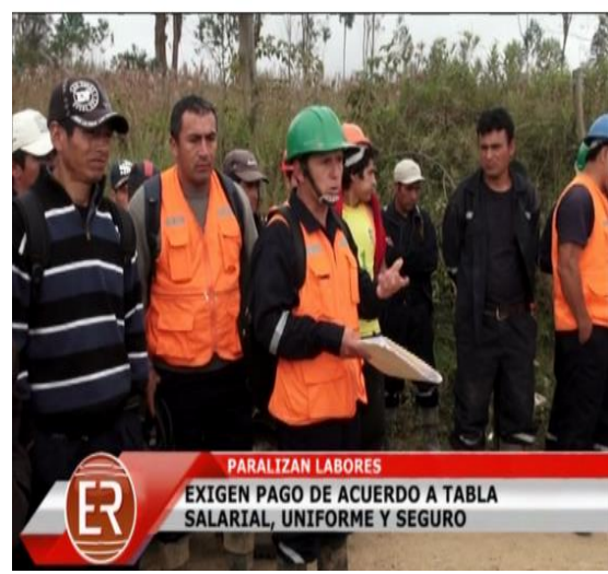
Figura N° 10 Y 11: Elementos gráficos en la edición de las noticias.