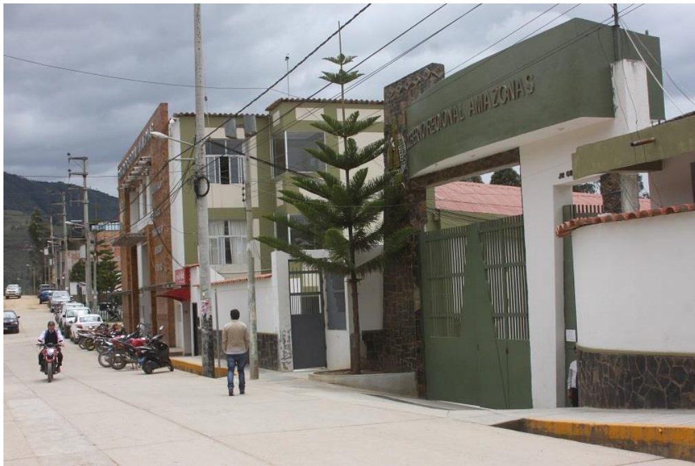
Figura N° 1: Sede del Gobierno Regional Amazonas en la actualidad