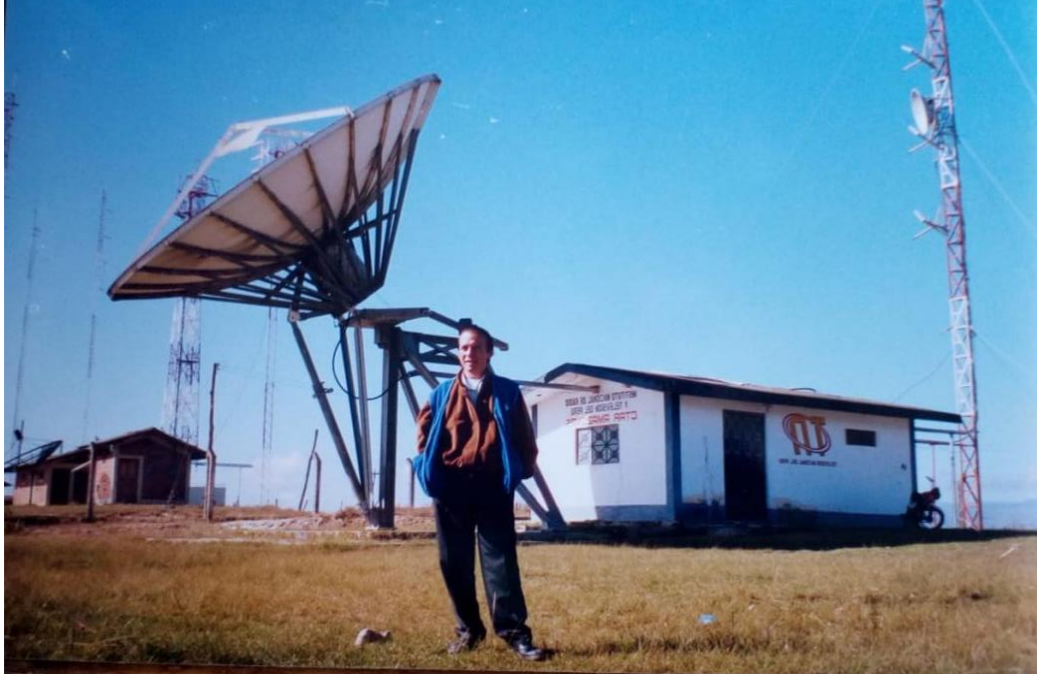
Figura N° 35: Planta de transmisión TV Regional, ubicado en el Cerro Colorado, en Chachapoyas.