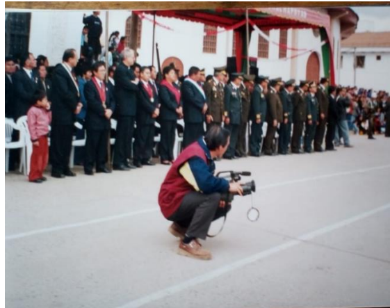
Figura N° 20 y 21: Cobertura de noticias de actividades oficiales. Visita del Embajador Plan Binacional Perú Ecuador. Camarógrafo en ceremonia de aniversario de creación política de la ciudad.