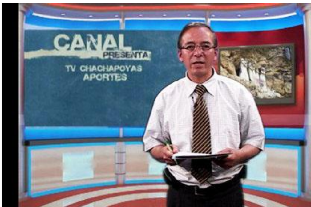
Figura N° 26: Conducción del programa sabatino "Aportes"