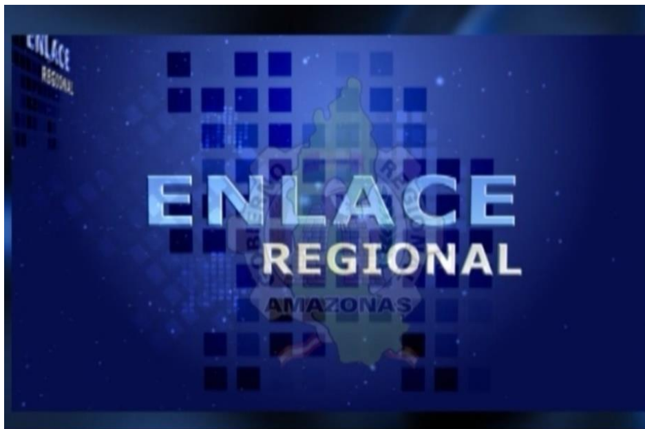
Figura N° 17: Intro del noticiero "Enlace Regional", duración 8 segundos