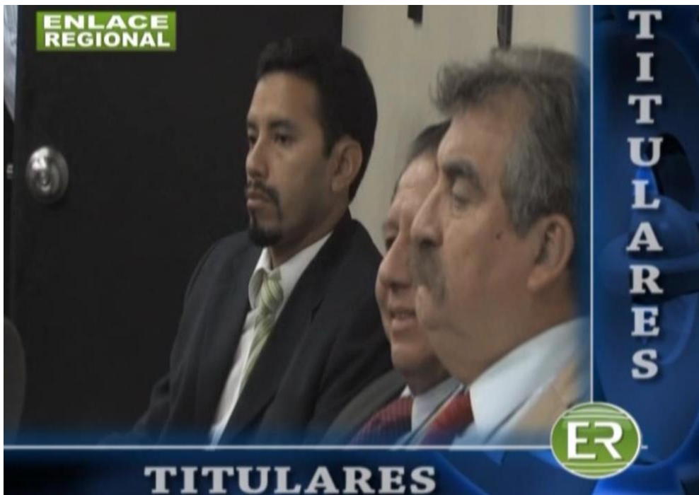
Figura N° 5: Titulares con voz en off