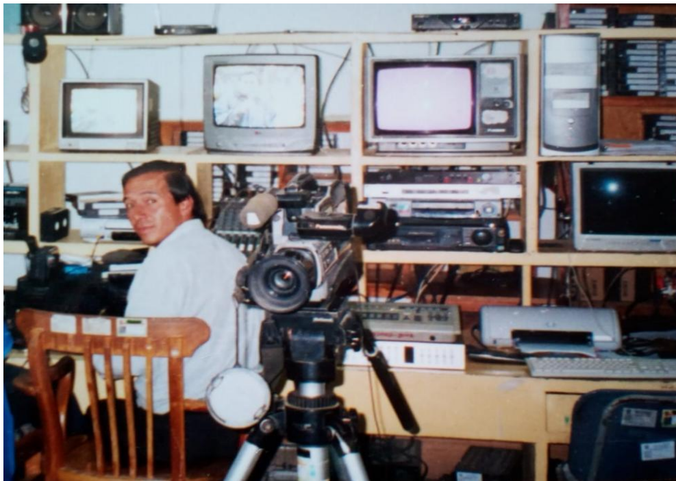
Figura N° 15: Antigua isla de edición, año 2000.