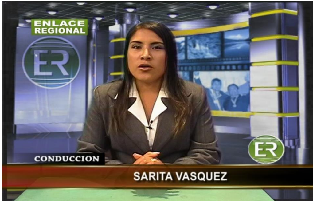
Figura N° 7: Conductora presentando las noticias