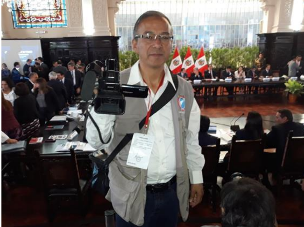
Figura N° 25: Cobertura informativa en Palacio de Gobierno, Lima.