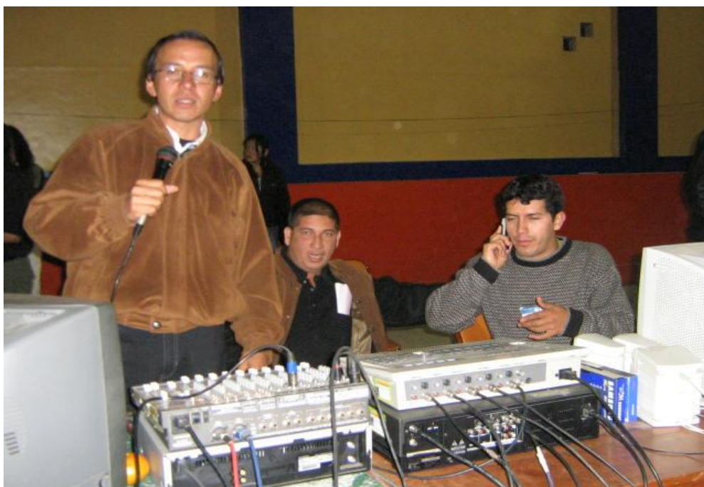
Figura N° 23: Grabación de locución de voz en off