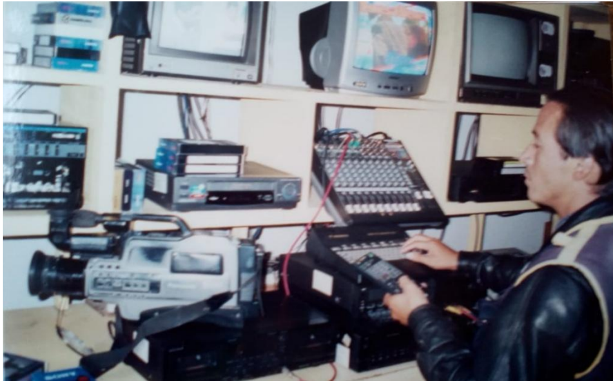
Figura N° 14: Edición del noticiero en sistema VHS (año 2005)