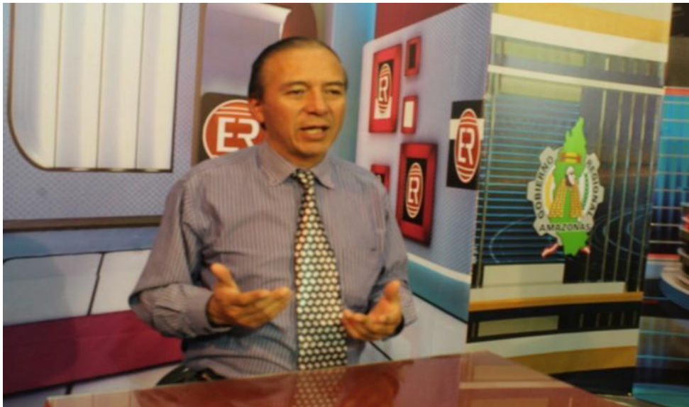
Figura N° 16: Conducción del programa.