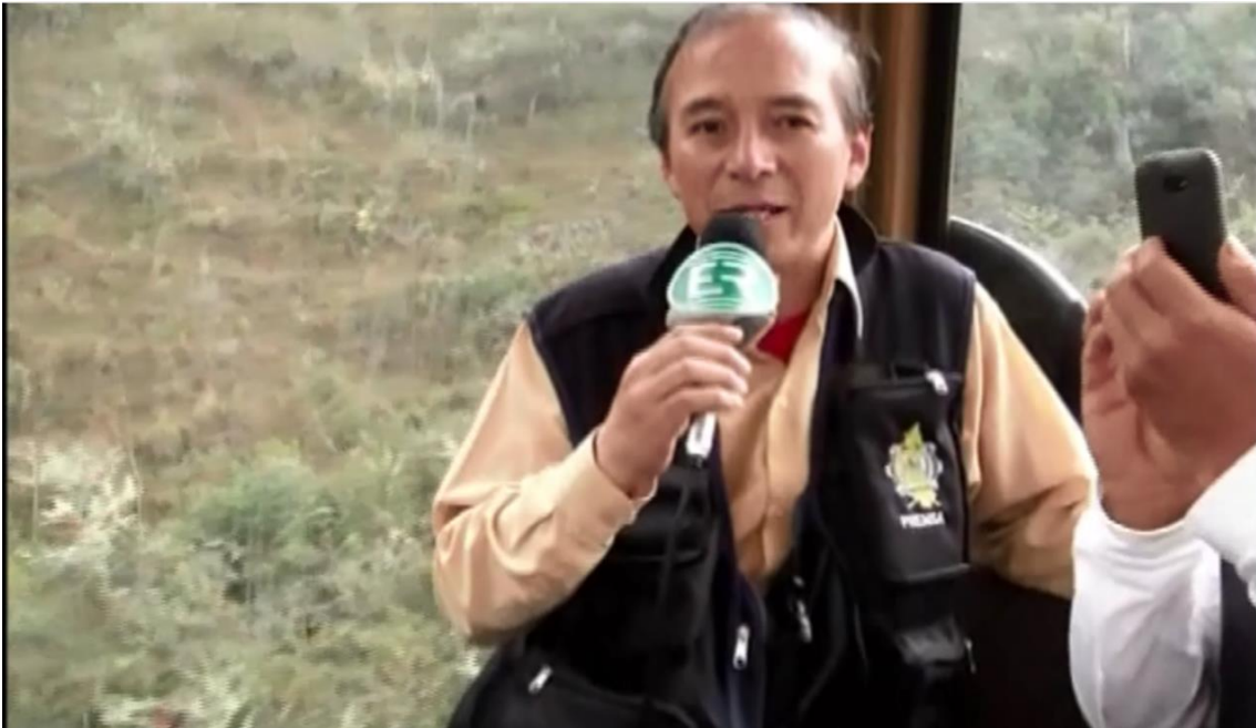
Figura N° 27: Cobertura informativa desde el Teleférico Kuélap.