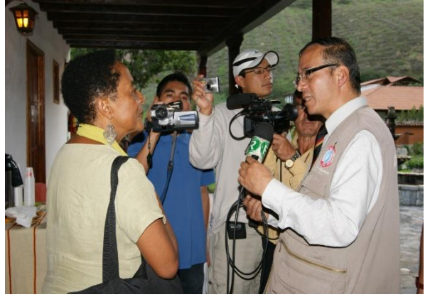
Figura N° 8 Y 9: Actividad reporteril. Entrevista al Gobernador Regional y a la Ministra de Cultura Susana Baca.