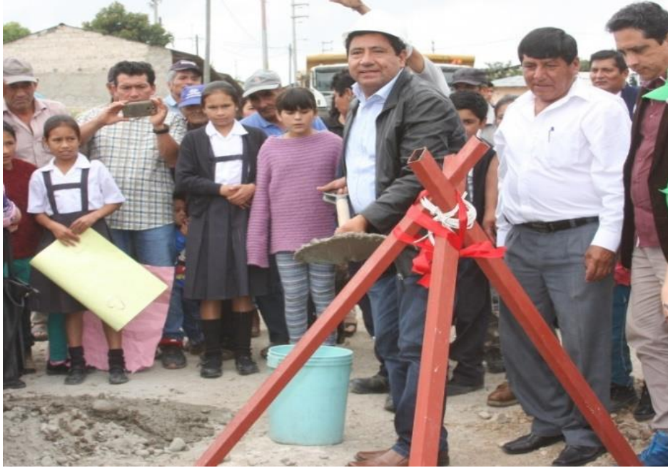
Figura N° 19: Actividad reporterial. Evento oficial en campo.