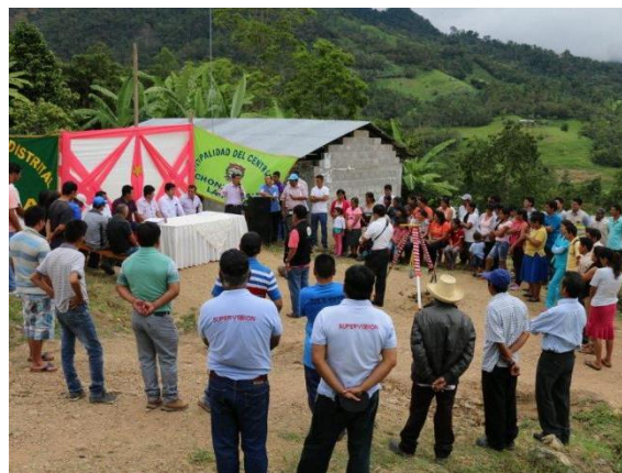
Figura N° 17 Y 18: Actividad reporteril. Conferencia de Prensa y actividad oficial en campo.