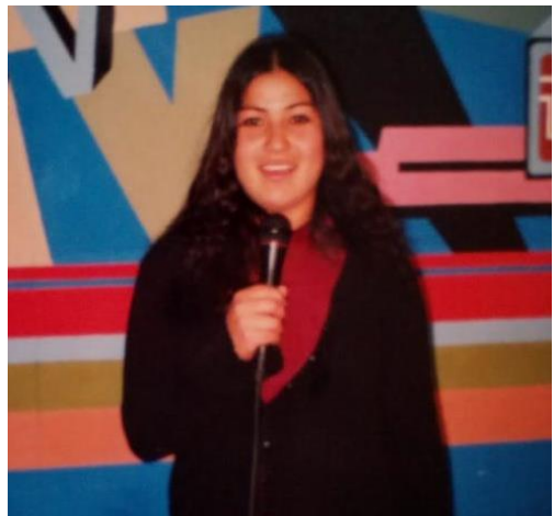
Figura N° 33 y 34: Personal durante labores diarias