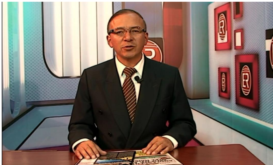
Figura N° 6: Secuencia de entrevistas