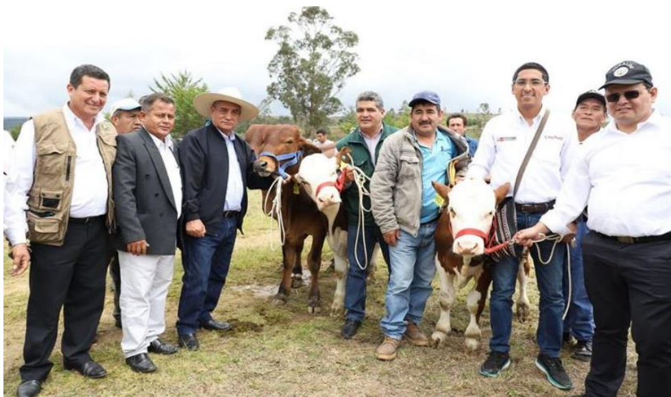
Figura N° 22: Cobertura informativa de actividad oficial