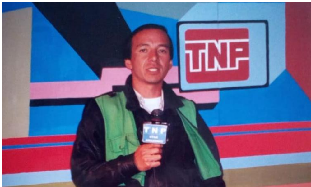
Figura N° 24: Locución en off