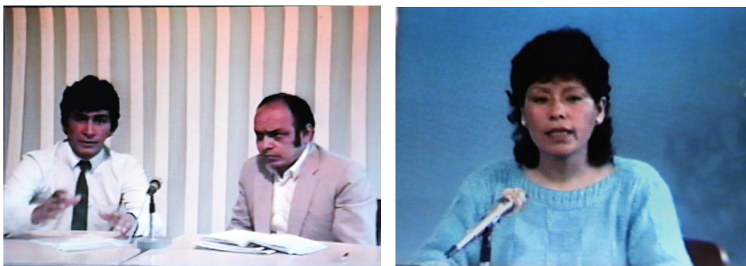
Figura N° 2 y 3: Escenografía de noticiero de los años 1992 y 1996