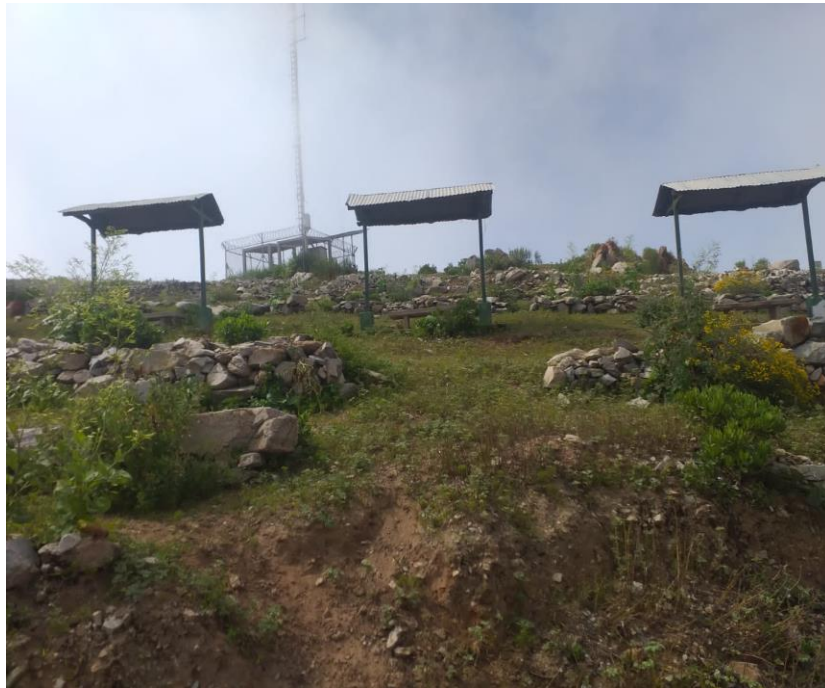
Figura 5: Canto Corral, lugar donde realizan un previo descanso los fieles para luego seguir caminando por un aproximado de 2 horas al Santuario.