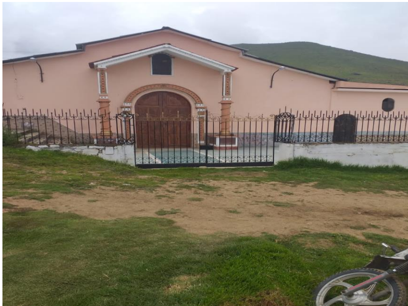
Figura 7: Santuario del Señor de la Ascecnion de Cachuy.