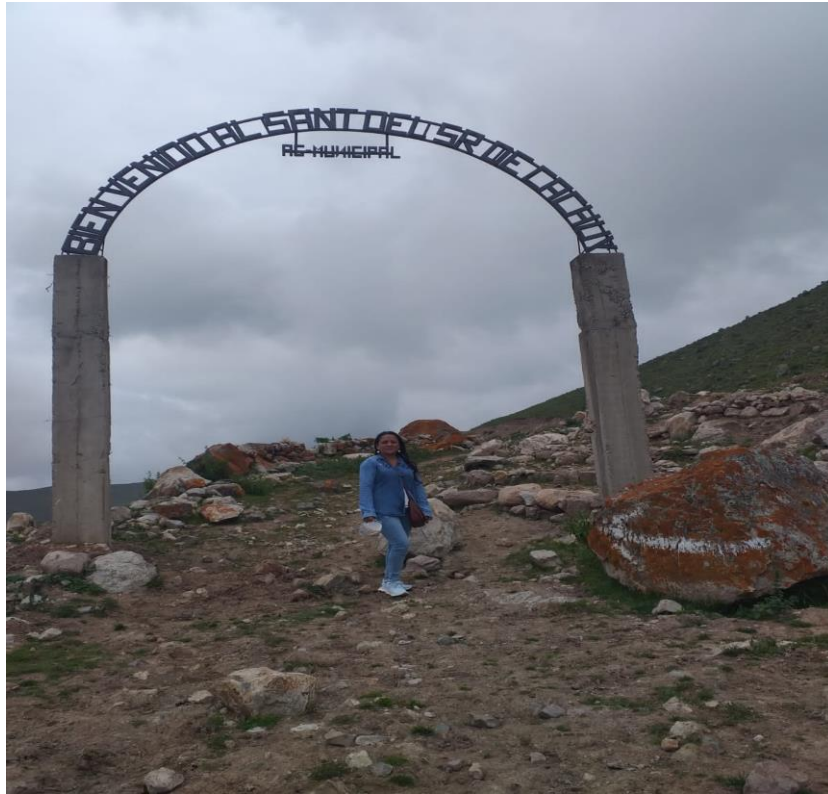
Figura 6: Portal de ingreso al Santuario del Señor de la Ascecnion de Cachuy.