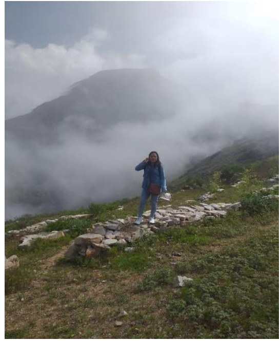
Figura 4: Bellezas escènicas en el recorrido del peregrinaje al Santuario del Señor de la Ascension de Cachuy.