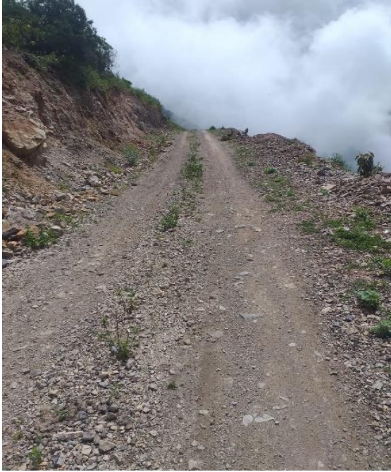
Figura 3: Trocha carrozable en el trayecto hacia las alturas de Cachuy