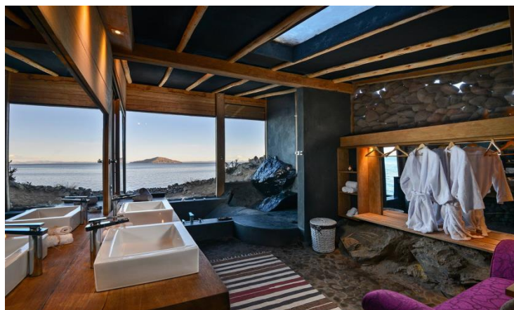
Interior de suite en Amantica Lodge