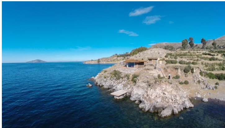
Vista de Amantica Lodge

En la actualidad en Amantani existen nuevas ideas de negocio una de ellas es Amantica Lodge que gracias a la colaboración de las comunidades locales y su deseo de conservar sus valores ancestrales en total armonía con los relieves geográficos y paisajes, con el uso de materiales de la zona como madera, totora, piedra, etc, ha logrado posicionarse como una nueva forma de turismo rural comunitario orientado a otro tipo de cliente más exigente que gusta del paisaje cultural y natural que posee la isla, situación que demuestra la diversificación del producto turístico de la isla.