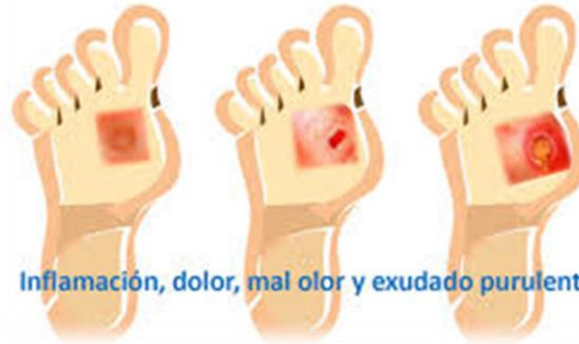
Inflamación, dolor, mal olor y exudado purulento

Los siguientes síntomas pueden indicar que su herida está infectada y que usted necesita atención médica: