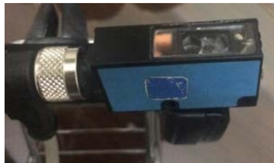
Figura 3. Sensor Intelligence SICK, fabricación Alemania.