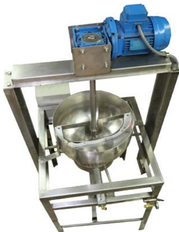
Figura 7. Prototipo de la máquina de frejol colado