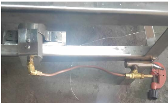
Figura 5. Electroválvula de control de gas