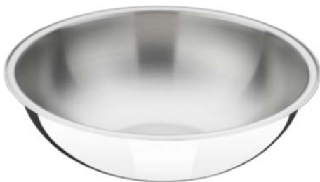
Figura 6. Recipiente para mezcla