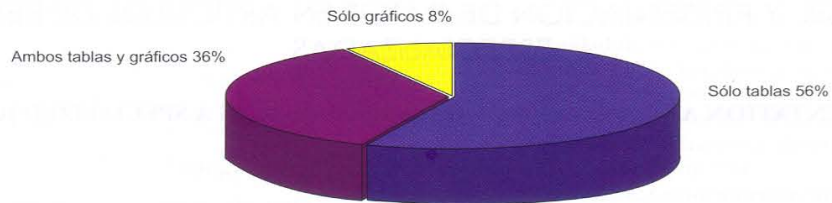
Figura 1: porcentaje de tablas y gráficos presentados por artículo

De aquellos artículos que utilizaron tablas, la mayor parte presentaron dos por artículo (36%), seguidos por el uso de tres y cuatro tablas por artículo (17 y 18%) y fueron pocos los que tenían mayor cantidad