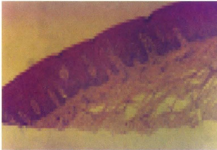
Fig. Nº 2: Mucosa palatina de paciente edéntulo, después de usar prótesis completa. Muestra: grosor de epitelio de 196.70 micras con queratinización incompleta y grosor de capa córnea de 11.82 micras. H.E. 100 X.

capa córnea se muestra más gruesa. La queratinización de la mucosa masticatoria palatina observada fue de tipo completa (ortoqueratinización) en un 83.33% de los casos estudiados.