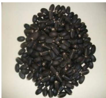
FIGURA 2. Semilla de Jatropha curcas L.

Los efectos biológicos reconocidos de la semilla de Jatropha curcas L. son respaldados por sus metabolitos secundarios, a la actualidad se conoce que presenta alcaloides, flavonoides, esteroides, lectinas, entre otros 9 .