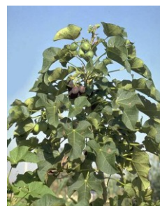
FIGURA 1. Jatropha curcas L o piñón blanco

En contraste, las investigaciones pre-clínicas han demostrado la actividad anti-fétil, antimicótica y acaricida de las semillas 4 ; así mismo, estudios de la raíz le infieren actividad anti-diarreica, antiinflamatoria 5 , cicatrizante, efecto abortivo, coagulante y anticoagulante del látex 6 y letalidad 7,8 .