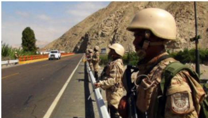
Las Fuerzas Armadas apoyarán a la Policía en la protección del terminal de Matarani.