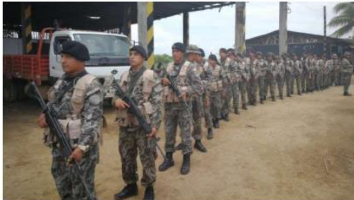
Durante la operación de control se realizarán intervenciones por aire, tierra y fluviales, través del río Malinowski.