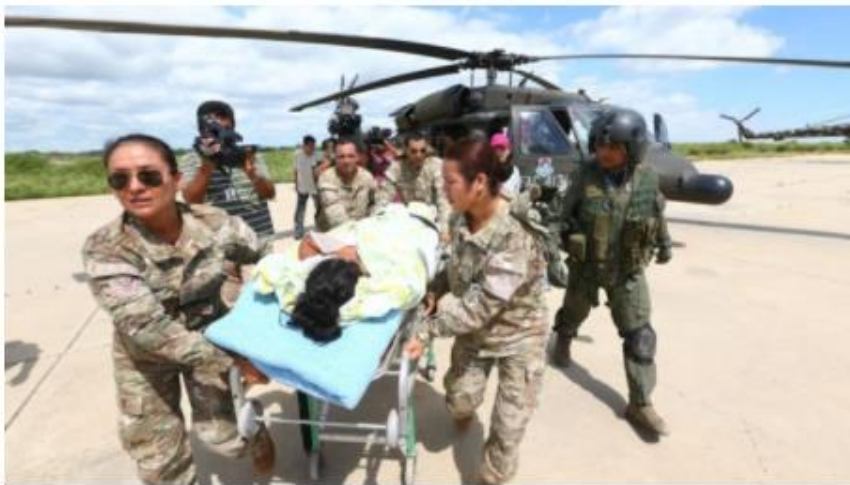
Militares trabajan intensamente para ayudar a damnificados en Piura.

Fueron movilizados 3,600 militares para operaciones de rescate o evacuación en zonas inundadas