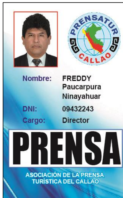
Carnet de prensa como director de Prensaatur Callao .