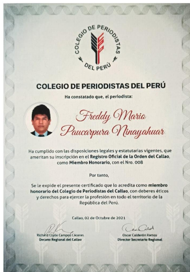
Constancia del Colegio de Periodistas del Perú - Región Callao como socio honorario.