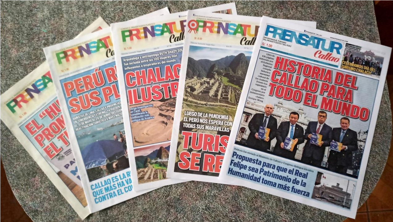
Anexo 4.- Ejemplares de Prensatur Callao impresos.