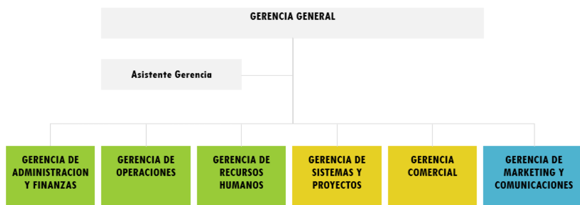
Figura 3. Organigrama de la empresa