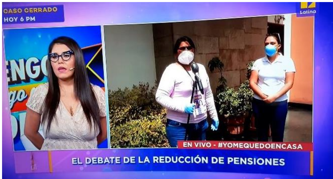
Anexo 6. Cobertura de caso social en el distrito de La Molina.