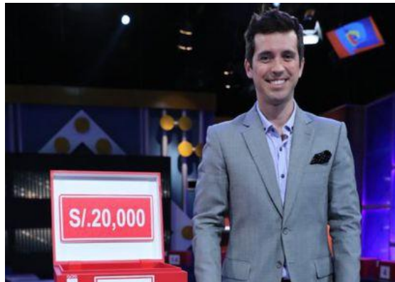
Figura 7. Programa de espectáculo ¿Vas o no vas?

De agosto a noviembre de 2016, fui contratada para trabajar en el programa “¿Vas o no vas?” de Panamericana Televisión , el programa de concurso y de entretenimiento que fue conducido por Jesús Alzamora, se dio inicio con un alto porcentaje de rating. Pero tenía un horario que no lo favorecía, pues en otros canales se presentaban programas que ya convocaban el horario.