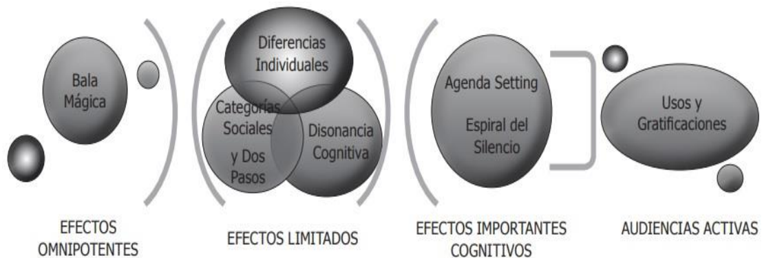
Figura 2: Teorías sobre la influencia de los medios.

desarrollaron diversas teorías que intentan comprender como influyen los mensajes transmitidos por la prensa.