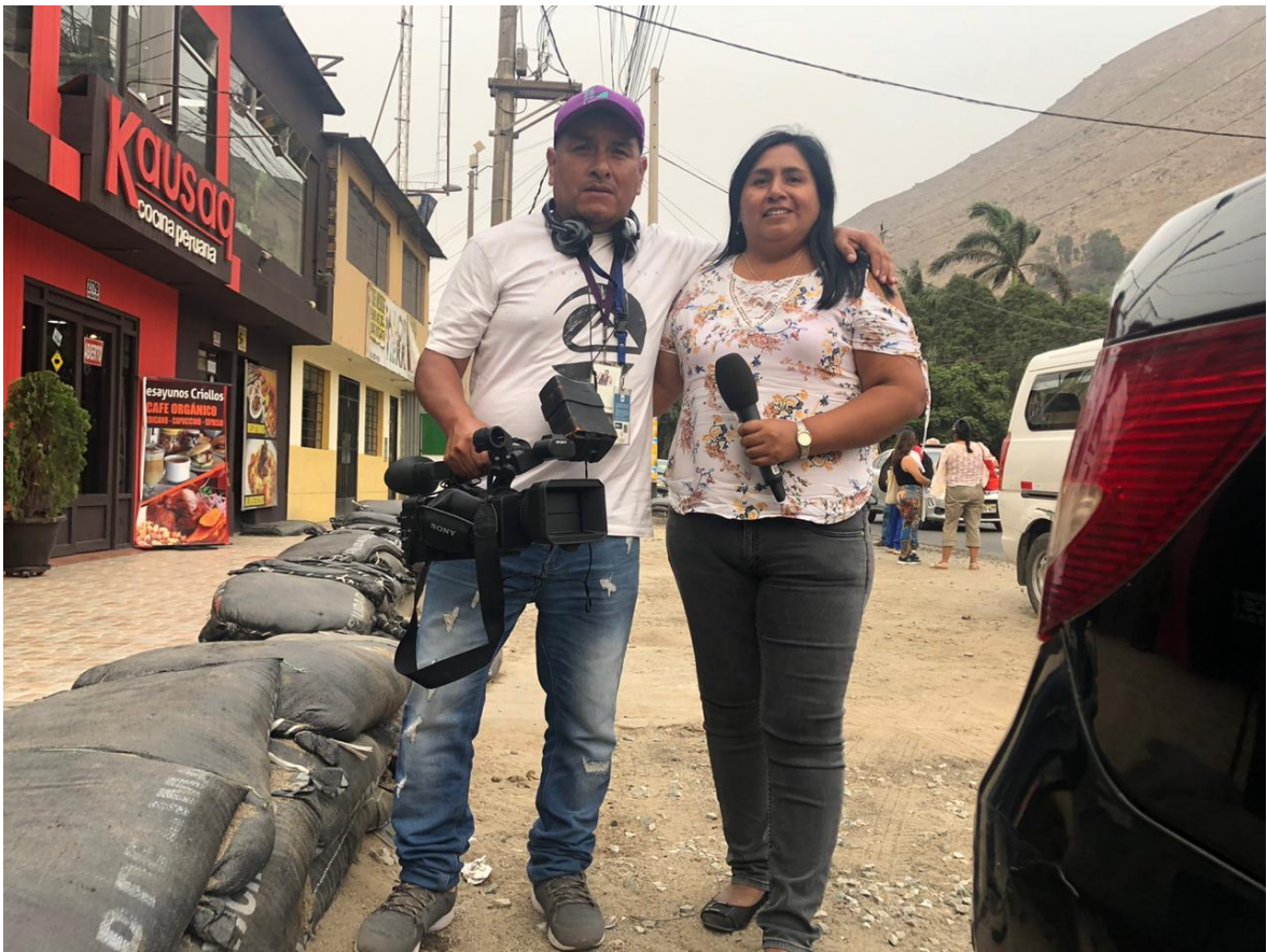
Anexo 4. Entrevista a empresario que dona 200 mascarillas.