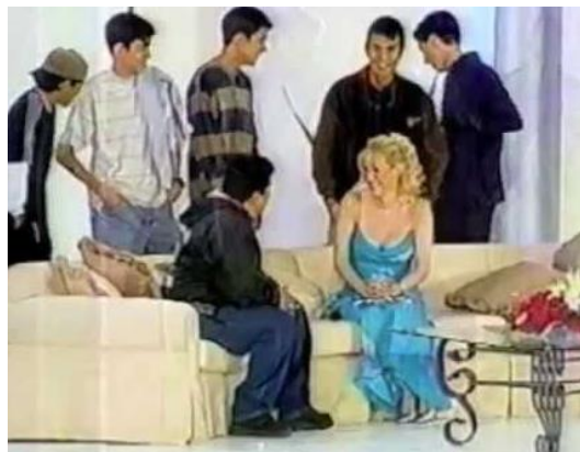
Figura 13. Reality Vale la pena soñar