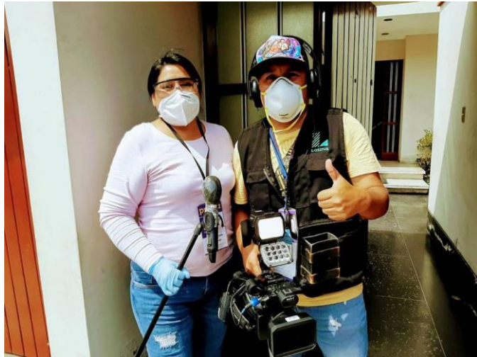
Figura 6. Comisión de reportaje de Tengo Algo que Decirte.

Existe un peligro inminente de contraer la enfermedad y el temor está presente; pero como profesional de comunicaciones es mi deber mantener al público informado. Por lo tanto, tanto yo como otros colaboradores debemos salir a las calles y continuar nuestra labor de investigación periodística.