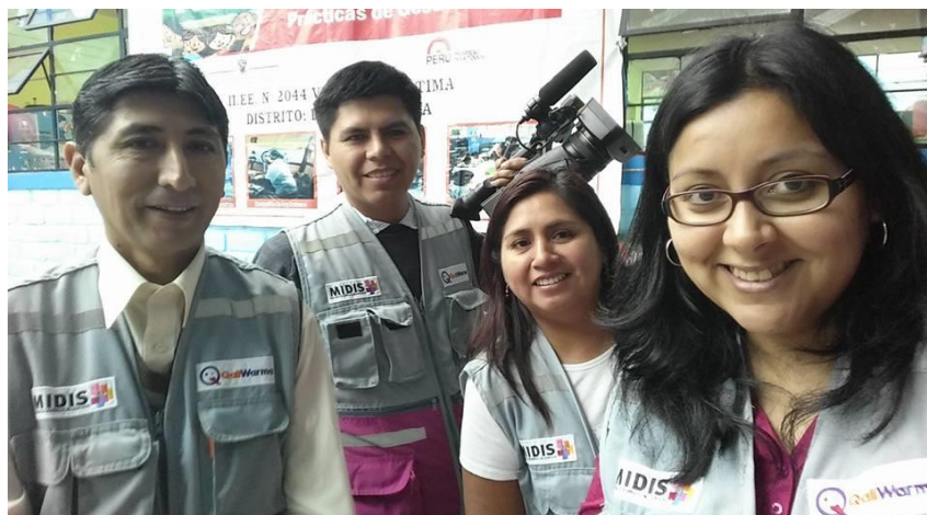
Figura 9. Equipo de comunicaciones del MIDIS.

He realizado coordinaciones permanentes con actores claves, concernientes al programa y otras actividades. Además de coordinar permanentemente con los medios de comunicación para concertar entrevistas y realizar enlace microondas.