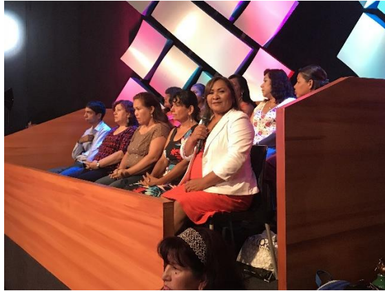
Figura 5. La tribuna del programa

Asimismo, soy responsable de la redacción de las historias que se recogen de los entrevistados, incluso he desarrollado la labor de reportera desde la microondas, para programas que se estaban transmitiendo en vivo, de manera que se evidenciaban las opiniones y posturas de las personas implicadas en las denuncias.