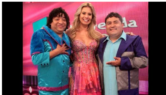
Figura 10. Programa Bienvenida la tarde

La primera labor que realicé en Frecuencia Latina fue cuando estuve contratada para el programa de espectáculo Bienvenida la tarde , desde octubre de 2011 hasta junio de 2012.