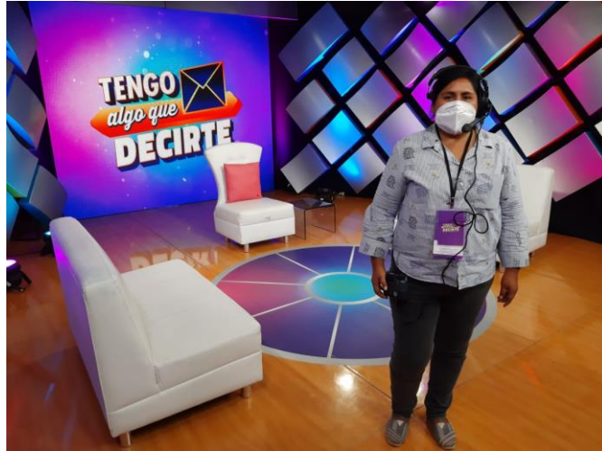
Figura 4. Set del programa Tengo Algo que Decirte.

Como parte de mis funciones están el establecer estrategias para investigar casos presentados en el programa, de manera que no sólo se muestre lo que es evidente, sino lo que está detrás de los hechos, o sea llegar a las raíces, tal como lo afirma Caminos en Camacho (2010) la investigación periodística se “... especializa en sacar a la luz los temas ocultos que personas o instituciones desean que no se hagan públicos y que el periodista, para publicarlos, precisa poner en práctica una técnicas especializadas de trabajo periodístico” (p. 41). Para ello es necesario recurrir a las fuentes de información ya que el informante puede dar otros datos, esta corroboración le da credibilidad al programa, y evita la desinformación.