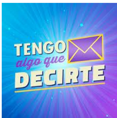
Figura 3. Logo del programa

información de la empresa mediadora de audiencia Ibope Time” (El Comercio, 12/10/2016, párr. 1).