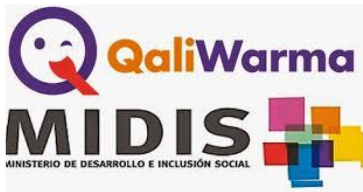
Figura 8. Logo del programa Qali Warma

Las funciones de las que me hice cargo son las de redacción y difusión a nivel nacional de notas de prensa y casos exitosos. Los casos que resaltaban servían de ejemplo para otras comunidades con la finalidad de dar a conocer el programa y su funcionamiento, demostrando su éxito en las diferentes provincias del país.