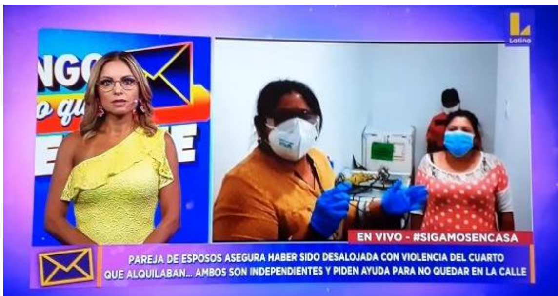
Anexo 8. Entrevista con las familias de los mototaxistas en Villa María del Triunfo.