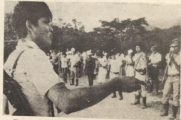
El arma más fuerte de los guerrilleros del PCP-SL es su ideología M-L-M, P.G.