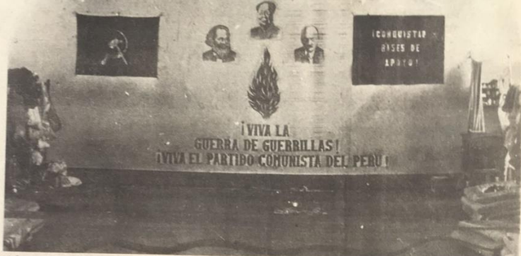
"Los marxistas-leninistas-maoístas, pensamiento Gonzalo, nos reafirmamos en la violencia revolucionaria para tomar el Poder".