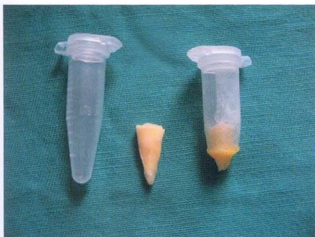
Figura 1: muestra colocada en Criovial Eppendorf