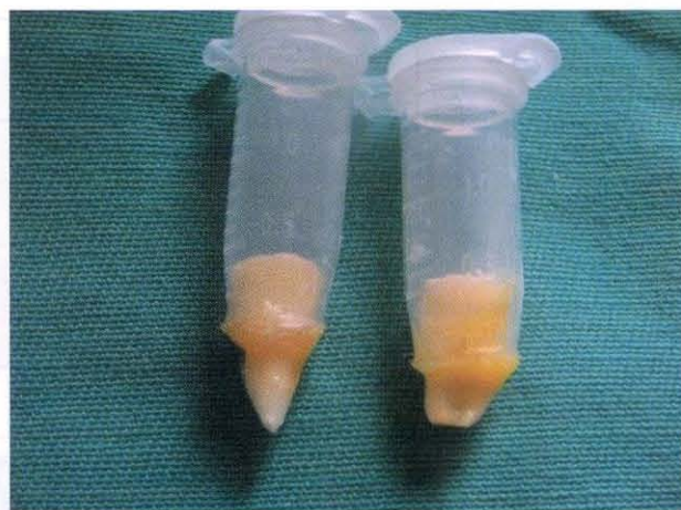
Figura 2: modelo de filtración bacteriana