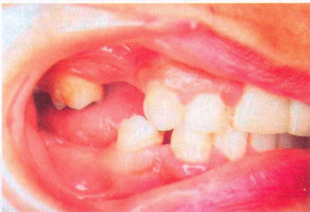
Foto 3. Vista lateral derecha. Se observa depósitos blandos y la ausencia de algunos piezas dentarias.