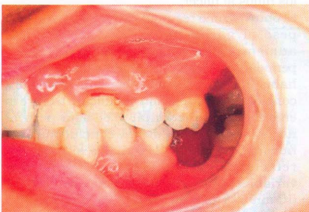
Foto 2. Vista lateral izquierda de la misma paciente. Se observa pérdida de inserción clínica, encías edematosas y sangrado espontáneo.