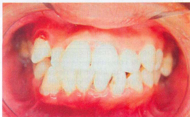
Foto 5. Paciente gestante con 20 semanas de edad gestacional, con diagnóstico de periodontitis crónica moderada.