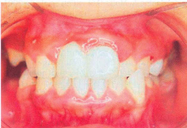
Foto 1. Paciente gestante con 20 semanas de edad gestacional con diagnóstico de periodontitis crónica leve.