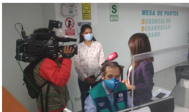
Nota: Foto tomada en las instalaciones de la Gerencia de Desarrollo Urbano.