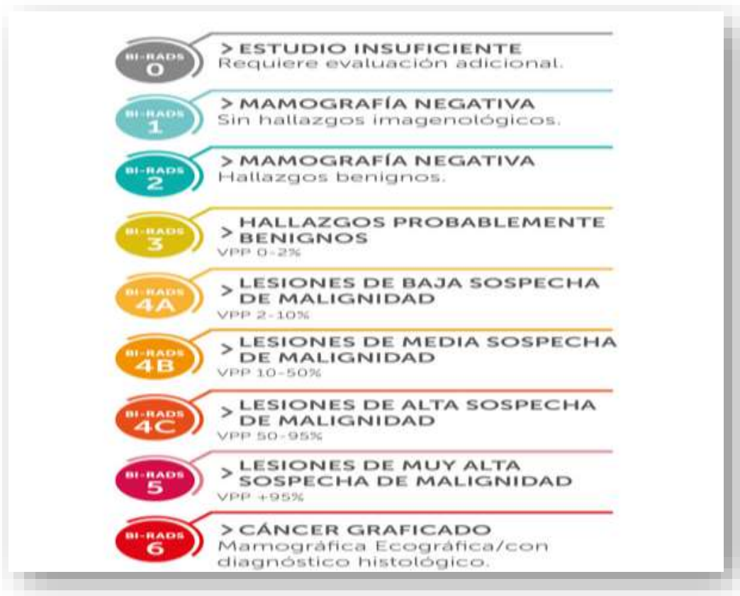
Figura 1. Breast Imaging-Reporting and Data System(40)

La clasificación más usada para el cáncer de mama es el BI-RADS (Breast Imaging-Reporting and Data System) utilizada para la evaluación de riesgos y garantía de calidad desarrollada por el Colegio Americano de Radiología, el cual brinda información ampliamente aceptada para la obtención de imágenes de la mama. Se aplica a la ecografía, mamografía y resonancia magnética(38,39). A los estudios de imagen mamaria se les delega una de las siete categorías de evaluación: