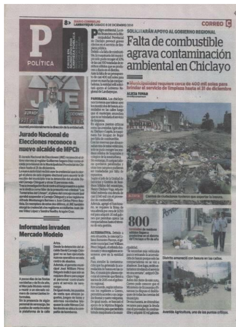
IMAGEN DE EDICIÓN ANALIZADA

Falta de combustible agrava contaminación ambiental en Chiclayo