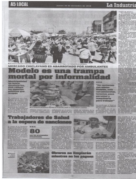
IMAGEN DE LA EDICIÓN ANALIZADA