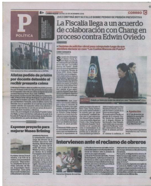
IMAGEN DE LA EDICIÓN ANALIZADA