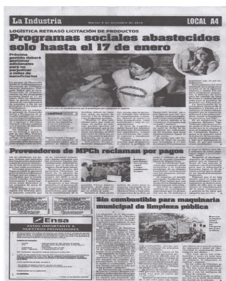
IMAGEN DE EDICIÓN ANALIZADA