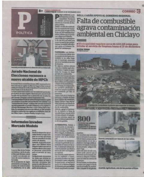
IMAGEN DE EDICIÓN ANALIZADA