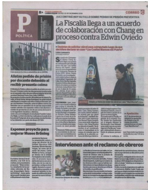
IMAGEN DE EDICIÓN ANALIZADA