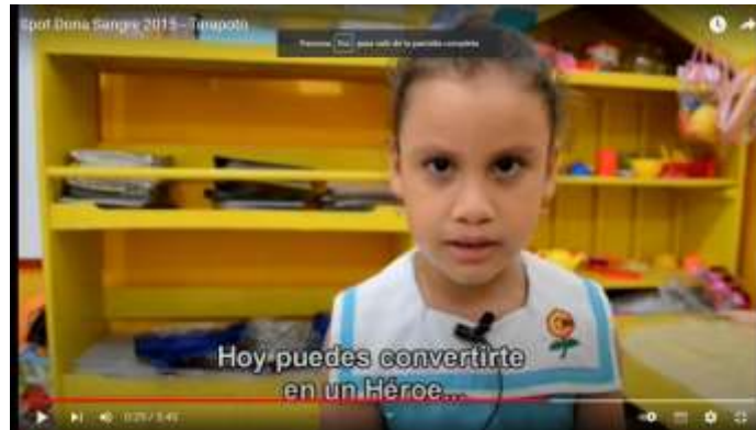
Spot Dona Sangre Niños 2015 – Tarapoto

https://www.youtube.com/watch?v=zyTygmcaU6I