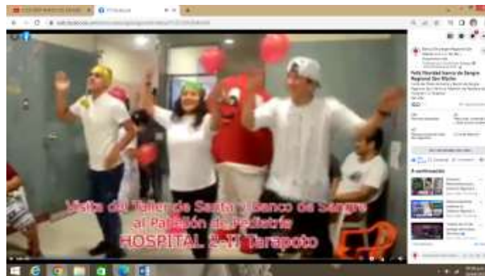
Visita del Taller de Santa y Banco de Sangre Regional San Martín al Pabellón de Pediatría del Hospital II-2 Tarapoto