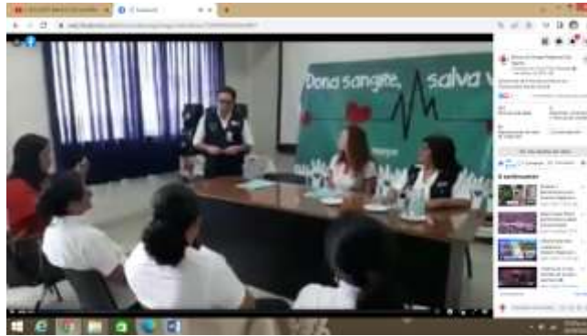
Ceremonia de firma de convenio con Distribuidora Santa Monica