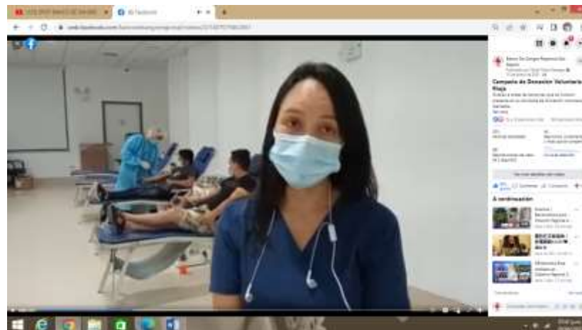
Video Informativo Campaña de Donación Voluntaria Rioja

https://www.youtube.com/watch?v=a5bxKtGylrE