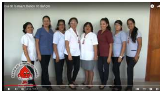
Dia de la mujer Banco de Sangre

https://www.youtube.com/watch?v=-NxagC7EW-I