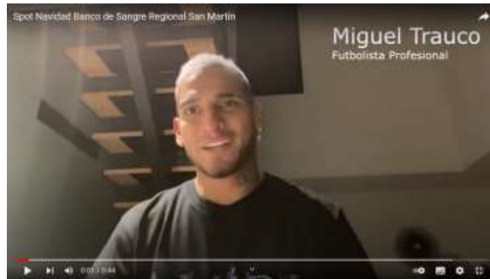
Spot Navidad Banco de Sangre Regional San Martín

https://www.youtube.com/watch?v=Hgdnb-XROM