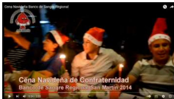
Cena Navideña Banco de Sangre Regional

https://www.youtube.com/watch?v=-NxagC7EW-I