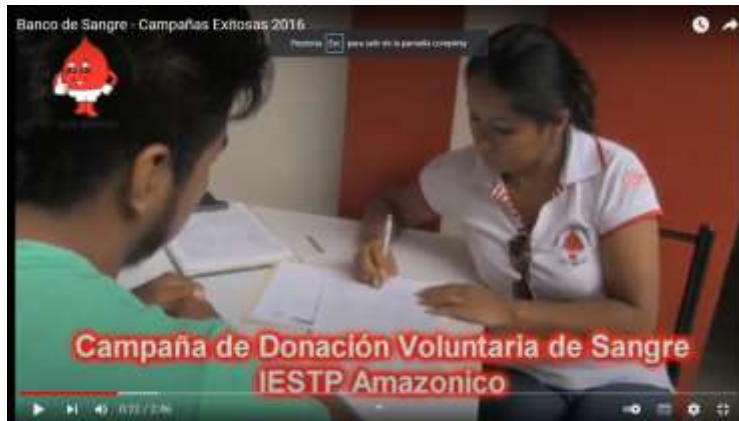
Banco de Sangre - Campañas Exitosas 2016

https://www.youtube.com/watch?v=kmSvFzGbVE8&t=67s