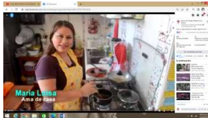
Spot La seguridad de la sangre depende de ti Ama de Casa

https://www.youtube.com/watch?v=Hgdnb-XROM