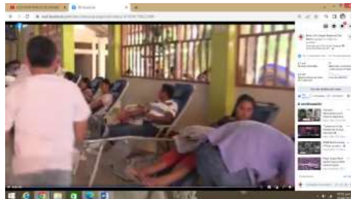
Spot Emergencia Dona Sangre

https://www.youtube.com/watch?v=zyTygmcaU6I